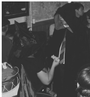
foto: Malfoy předává ministryni kouzelný dekret o odvolání Brumbála

Včerejší ministerský bál byl svědkem šokující události. Lucius Malfoy získal od správní rady Bradavic povolení pro odvolání Brumbála s ředitelského křesla. Na jeho místo byl správní radou jmenován učitel lektvarů Severus Snape. Dle našich vnitřních informací je Snape jen loutkou lorda Voldemorta, a tak se velmi pravděpodobně změní vyučovací předměty. Vyučování bude orientováno hlavně na výuku předmětů týkajících se černé magie. Nový pan ředitel Snape se nechal slyšet, že prvním krokem ovšem bude vyloučení všech mudlovských a polomudlovských rodin.