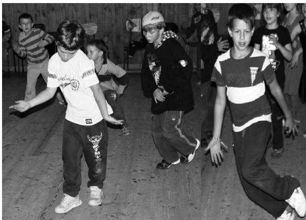
Foto: zleva Martin, Vašek, David, Aleš (pátý člen Matouš opustil kaple ještě před jejím proslavením.)

Redaktoři našeho časopisu se rozhodli, že důkladně prozkoumají legendární bradavický archiv. Zašli jsme za hlavním školní knihovnicí paní Pinceovou, aby nám pomohla najít nějaké pikantnosti ze života školy. Kromě Brumbálových prvních mléčných zubů a Voldemortova tahacího kačera jsme našli fotografii členů kapely Lunetic, kteří do Bradavic chodili a dali se tady jako kapela dohromady. Paní Pinceová vzpomíná: „Chlapci byli velmi talentovaní, první vystoupení proběhlo již v roce 1990, kdy chlapcům bylo necelých deset let. Dodnes nezapomenu, jak se celé Bradavice kroutili v bocích a jed- nohlasně zpívali Jsi moje máma.“ Jako důkaz předkládáme fotodokumentaci.